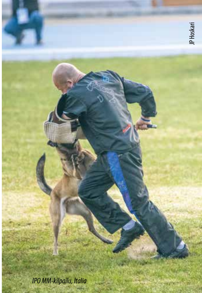
IPO MM-kilpailu, Italia

laitos, Sosiaali- ja terveysjärjestöjen avustuskeskus (STEA), Suomen Pelastusalan Keskusjärjestö, Vapaaehtoinen pelastuspalvelu ja Suomen Pelastuskoiraliitto.