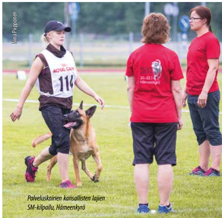
Palveluskoirien kansallisten lajien SM-kilpailu, Hämeenkyrö

Toimikunta kokoontui Skype-kokouksilla yhdeksän kertaa. Lisäksi pienryhmissä työstettiin muutoksia toimihenkilökoulutusohjeisiin ja arvosteluohjeisiin. Näiden työstäminen jatkuu vuonna 2019.