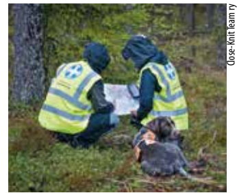
Close-knit team ry

Lisätietoja: peko@palveluskoiraliitto.fi